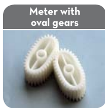
Meter with oval gears