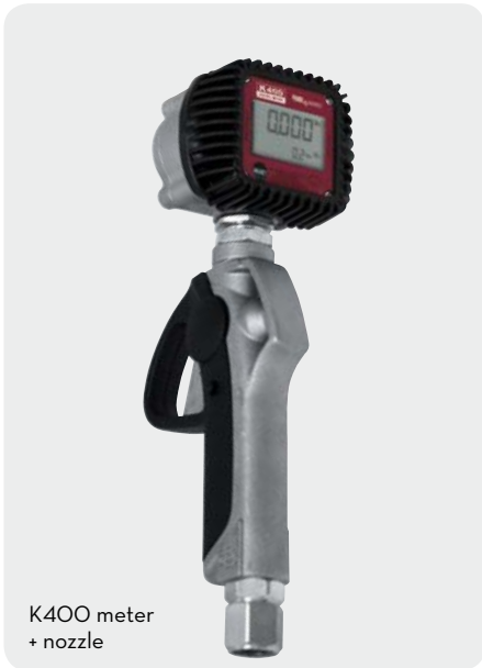
K400 meter + nozzle