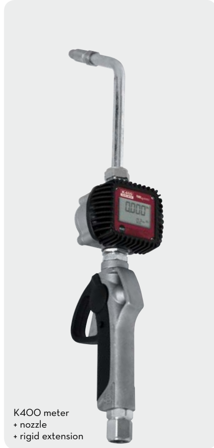
K400 meter + nozzle + rigid extension