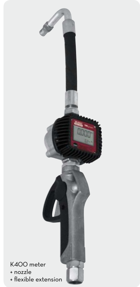
K400 meter + nozzle + flexible extension